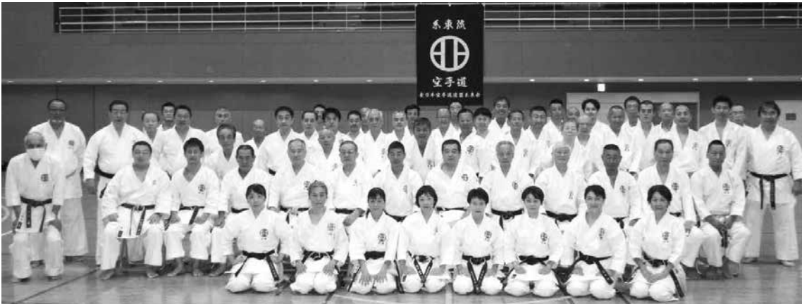
講習会参加した選手の皆さん。

新型コロナウイルス感染防止対策の中、一日で実施された講習会であったが、受講者からは日頃の稽古で抱えている疑問点の投げかけが多くあり、それに対する講師の先生方の熱意に満ちた指導で大変有意義な講習会となった。