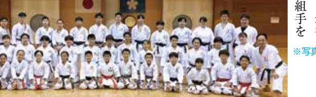
※写真上は組手、下は形の集合写真