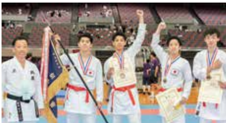
■一般団体【優勝】兵庫県B【準優勝】山梨県