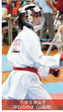
小学 5 年女子 孕石ののほ (山梨県)