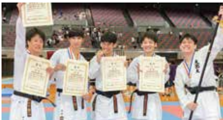
■大学団体【優勝】大阪商業大学【準優勝】大阪工業大学