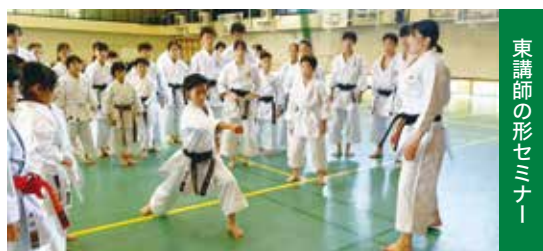
東講師の形セミナー

技である中段突きをベースに、頭の下を抑えたステップからの技出しを練習。最適な間合いの理解、自ら入る突き、反応する突き、誘われた後の対処など、実戦的な展開を学びました。「良い準備・姿勢・タイミング」の重要性が強調されました。 高学年が低学年を一生懸命サポートする姿や、笑顔で成長を報告する子供たちの姿に、糸東流の本質を感じる清々しい一日となりました。 講師の両名からは「自分たちの学びのほうが多く、とても感謝しています。選手の皆さんの活躍を心から応援しているので、できると信じて頑張ってください」と、選手たちへ温かいエールが送られました。