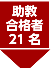
えぐち・まなぶ 江口 学