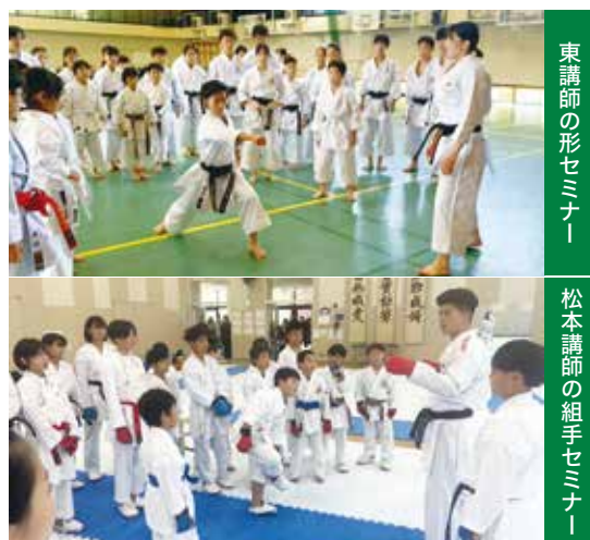
東講師の形セミナー